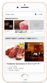
グルメガイドページ