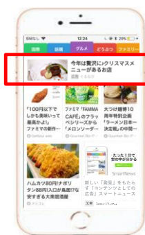
グルメチャンネルトップ

今後は、ぐるなびの持つ良質なグルメ情報を、スマートニュースのユーザーへ、より最適な形で届けられるよう、新機能や既存機能の改善の検討を進めてまいります。