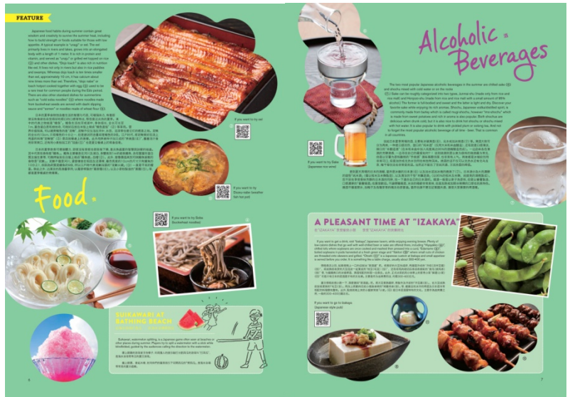
▲特集ページ イメージ